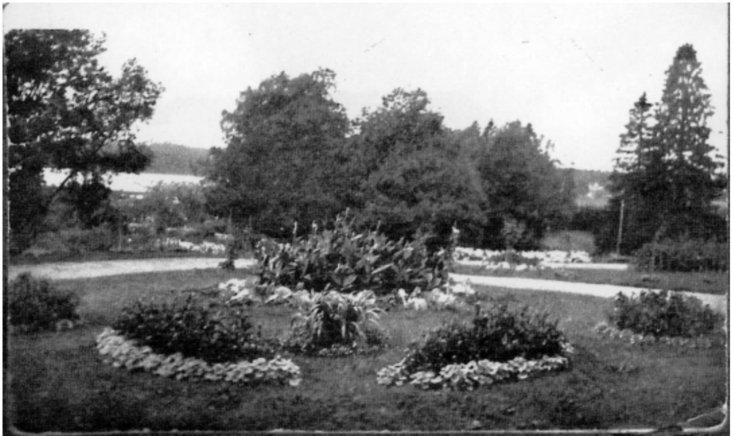
Kuva 2. Arrajoen puutarhaa kartanon päärakennuksen länsipuolelta 1919. Taustalla on Sylvöjärvi.